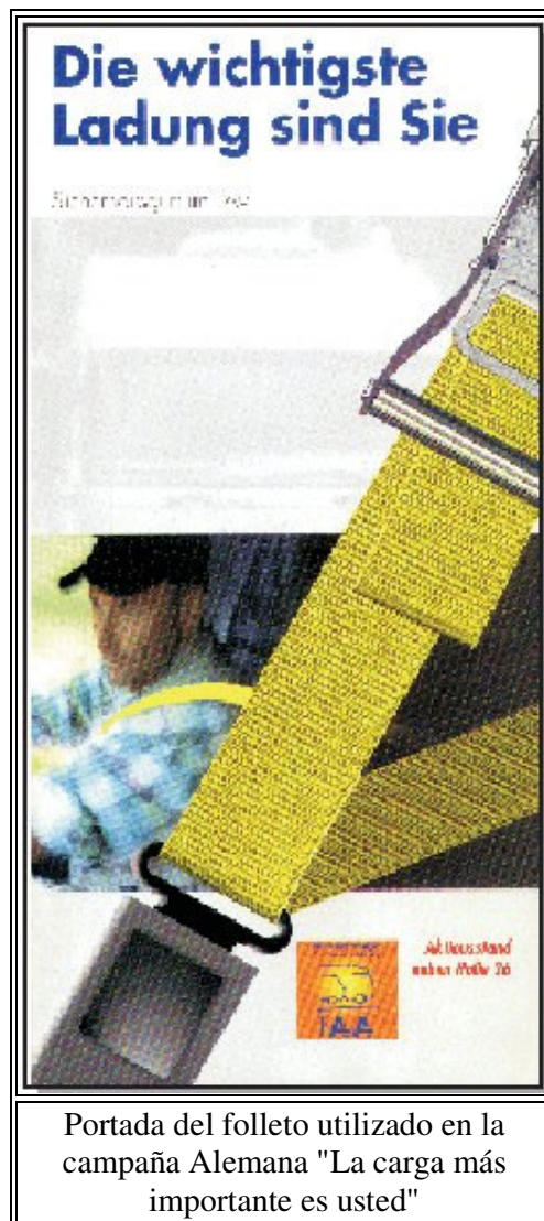
Portada del folleto utilizado en la campaña Alemana "La carga más importante es usted"